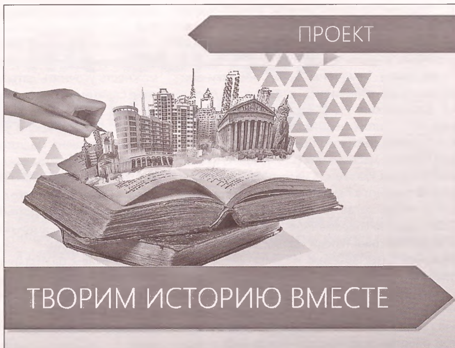
■ Логотип проекта новокузнецких библиотекарей

Эту важную информацию собирали библиографы С.И. Свириева, О.В. Быкова и я, автор этих строк. Поиски длились более 50 лет! Библиотекари выяснили, что наш город по праву может